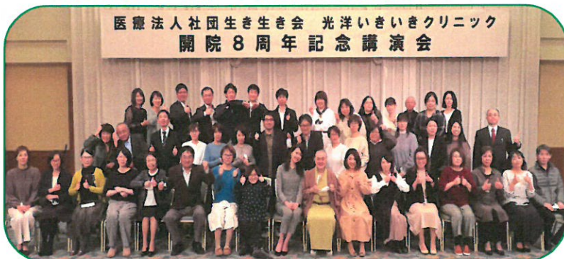
医療法人社団生き生き会 光洋いきいきクリニック 開院8周年記念講演会