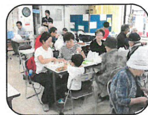
院内飲食コーナー