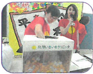
チャリティー大抽選会