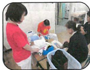
骨密度測定検査体験