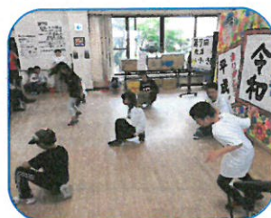
ヒップホップダンス BEEF.W CREW 様