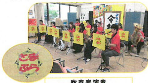
吹奏楽演奏 苦小牧プラスサウンズ様