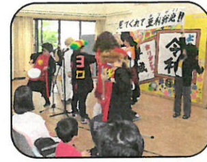
職員による催し物