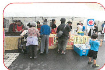
飲食コーナー 吞菜とんとことん様 料理のかたくら様