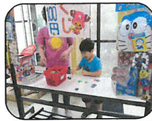
おもちゃくじコーナー