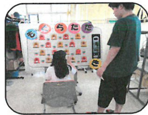
もぐらたたきゲーム