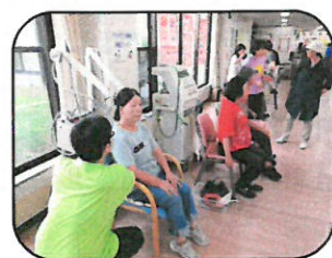
リハビリ機器体験